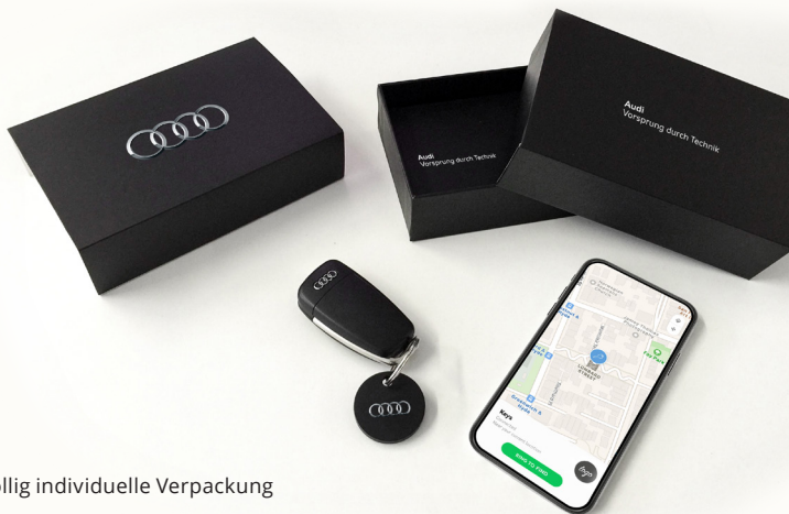
Völlig individuelle Verpackung