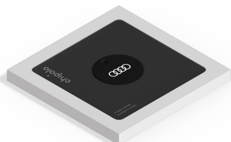
Flache Werbeverpackung 106 mm × 106 mm × 9 mm