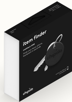
Standard Verpackung 106 mm × 30,8 mm × 106,5 mm, W: 70 g